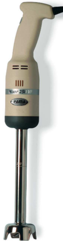
MIXER 250 VF