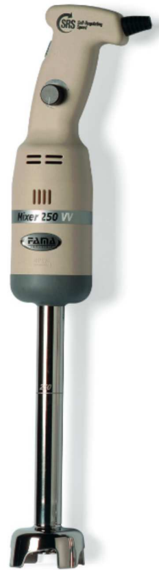
MIXER 250 VV